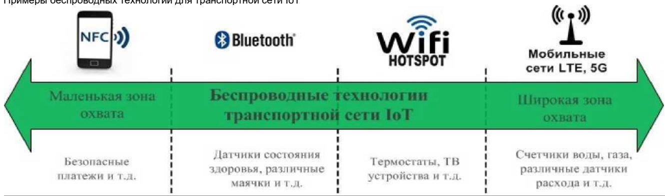
Рисунок 1 Примеры беспроводных технологий для транспортной сети IoT

данных в мире увеличился на 60 %. В ближайшие годы такая тенденция сохранится — трафик данных в сотовых сетях будет расти со среднегодовым темпом 45% за счет роста числа подключений на базе смартфонов, в основном с поддержкой LTE.